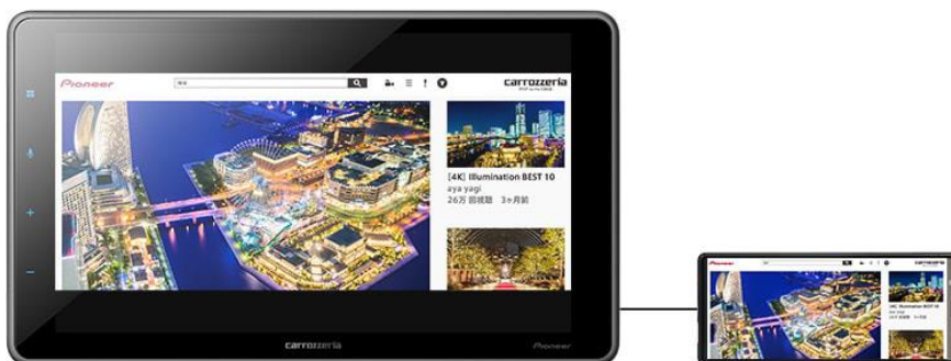
【カロッツェリア ディスプレイオーディオ「DMH-SF500」での WebLink Cast 使用イメージ】

「WebLink」のキャスト機能「WebLink Cast」を使用することで、接続したスマートフォンの画面を映し出すだけでなくディスプレイオーディオの画面上で操作が可能です。また、スマートフォンに保存されている音楽や動画ファイルにアクセスすることができます。